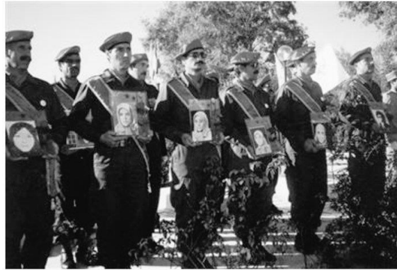
Members of the Iranian group Mojahedin-e-Khalq display pictures of martyrs at their camp in Ashraf, Iraq

By Terry Glavin, National Post June 30, 2009